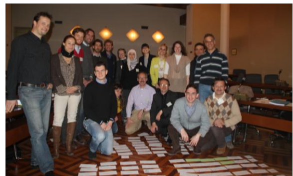
Futuri istruttori progettisti e artigiani Passive House a Cesena; foto: Passive House Institute

Progettisti e artigiani qualificati sono strategici per la realizzazione, su larga scala, di edifici consumo energetico quasi zero. Nell'ambito del progetto PassREg, i corsi rivolti a progettisti ed artigiani Passive House precedentemente realizzati da PHI sono in fase di traduzione nelle diverse lingue dell'Unione Europea e saranno adattati alle condizioni climatiche locali e alle tradizioni edili. Sono stati formati futuri formatori in diversi paesi europei incaricati di tenere corsi specifici con lo scopo di portare avanti questi corsi su larga scala, anche oltre i tre anni della durata del progetto.