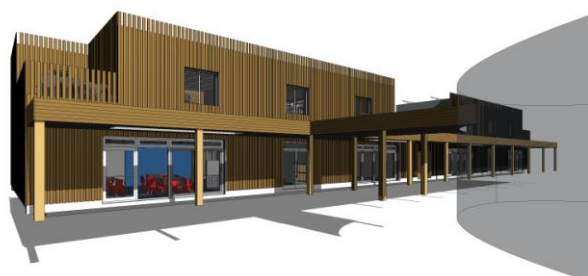
Immagine: Carmarthenshire County Council Development of Renewable Energy

La Scuola di Burry Port (Carmarthenshire, Galles), attualmente ancora in fase iniziale di progettazione, è concepita per essere costruita seguendo gli standard Passive House. L'amministrazione locale di Carmarthenshire, motivata dalle recenti costruzioni di altre scuole Passive House nel Regno Unito, è desiderosa di dimostrare l'applicabilità degli Standard Passive House alle scuole nella regione del Galles. L'intento è quello di garantire all'autorità locale costi di gestione economici e a lungo termine e un ambiente sano per gli alunni e gli insegnanti impegnati nella promozione dell'apprendimento. Info sul progetto