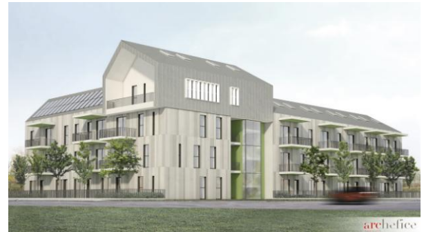
Social Housing Case Finali / studio associato Archefica

vicinanze di una collina. Il progetto di Case Finali è un edificio di diversi piani con 25 appartamenti. Progettato dallo studio di architettura Archefica, l'edificio è caratterizzato da una rivisitazione della tipologia a ballatoio con gli accessi agli appartamenti da un lungo semi-privato balcone. Info sul progetto