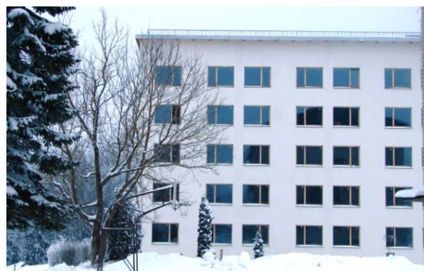
Ergli Vocational Secondary School

e alla formazione dell'intera regione di Ergli. Info sul progetto