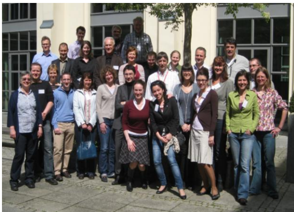
Partecipanti al Kick-off Meeting di PassREg

Il ruolo primario che Francoforte riveste nell'edilizia ad alta efficienza energetica è chiaro: con una politica efficace sono stati finora costruiti, seguendo gli standard Passive House, più di 1600 appartamenti, oltre a numerose scuole, asili e altri edifici non residenziali. Diversi viaggi-studio hanno offerto ai partecipanti l'occasione di visitare, sia a Francoforte che ad Heidelberg, edifici completati o in fase di costruzione e progetti di ristrutturazione. Ad Heidelberg, ulteriore regione all'avanguardia coinvolta nel progetto appena a 100 km più a sud di Francoforte, è in fase di costruzione un intero quartiere di 116 ettari completamente conforme allo standard Passive House.